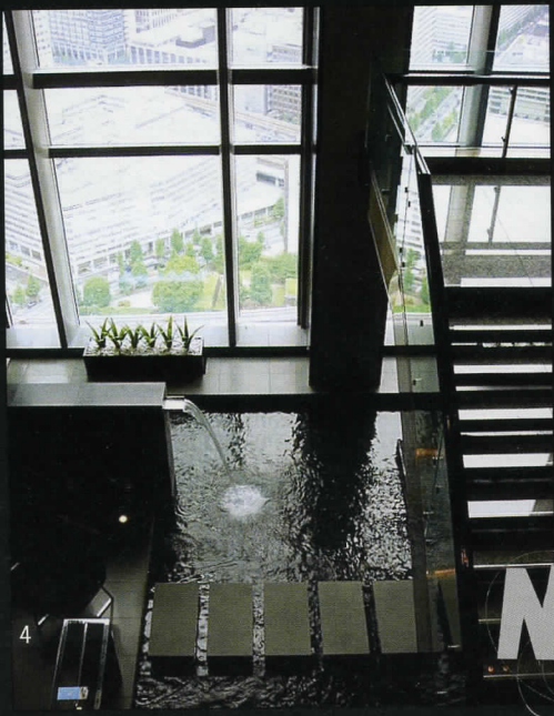
4. Изглед от интериора на хотел Mandarin Oriental Tokyo.

Разхождайки се из Токио, можем да срещнем най-невероятни типове хотели – само за бизнесмени, пътуващи по работа, или така наречените „капсули хотели“ (на много изгодни цени), или такива за влюбени двойки (love hotel), или нещо между хотел и интернет клуб за любители на японската манга (комикси), или сауна със стая-капсула за нощувка – изобилието е наистина голямо и може да задоволи всякакви вкусове и желания.